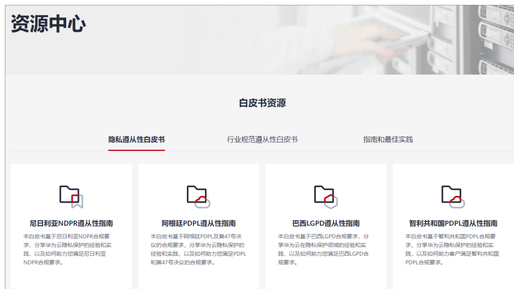
图 5-3 资源中心